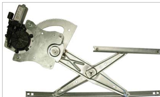
POWER WINDOW RIGHT ALZACRISTALLI ELETTRICO DX

THIS INSTALLATION INSTRUCTION IS FOR BOTH LEFT AND RIGHT SIDE. CETTE INSTRUCTION DE MONTAGE EST POUR LES DEUX COTES DROIT ET GAUCHE. DIESE MONTAGE-ANLEITUNG IST FÜR DIE BEIDE LINKE UND RECHTE SEITE. ESTA INSTRUCCION DE MONTAJE ES PARA LOS DOS LADOS IZQUIERDO Y DERECHO. ESTAS INSTRUÇÕES VALEM TANTO PARA O LADO ESQUERDO QUANTO PARA O DIREITO. DEZE AANWIJZINGEN GELDEN VOOR ZOWEL DE LINKER- ALS DE RECHTERKANT. Η ΠΑΡΟΥΣΑ ΟΔΗΓΙΑ ΑΦΟΡΑ ΤΟΣΟ ΤΗΝ ΑΡΙΣΤΕΡΗ ΟΣΟ ΚΑΙ ΤΗ ΔΕΞΙΑ ΠΛΕΥΡΑ. LA PRESENTE ISTRUZIONE VALE SIA PER IL LATO SINISTRO CHE PER IL LATO DESTRO.